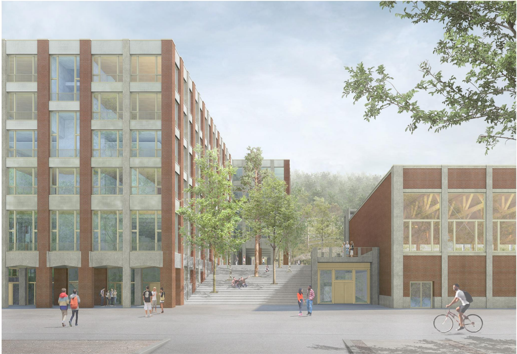
Zugang Campus KSA