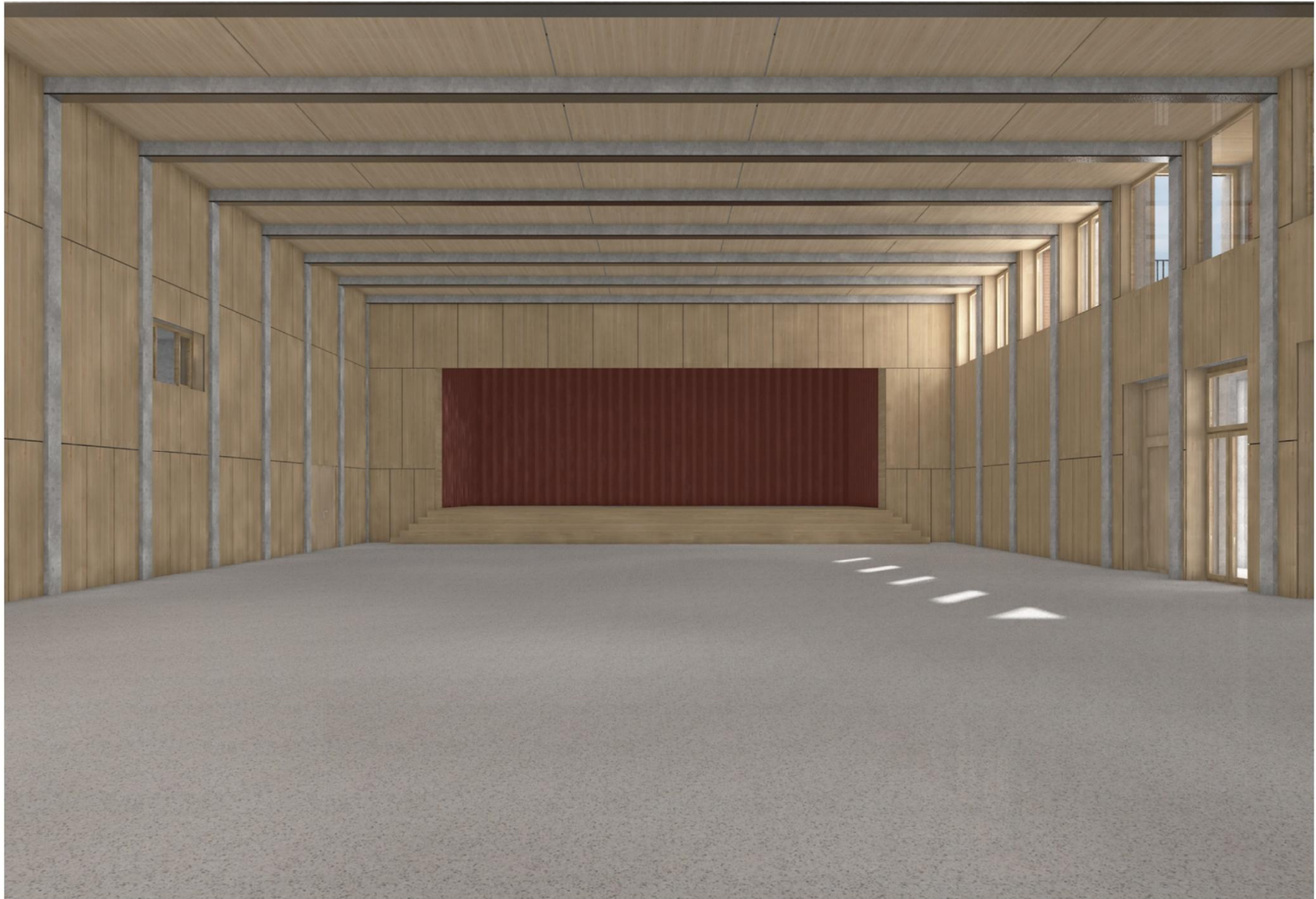
Aula / Bühne