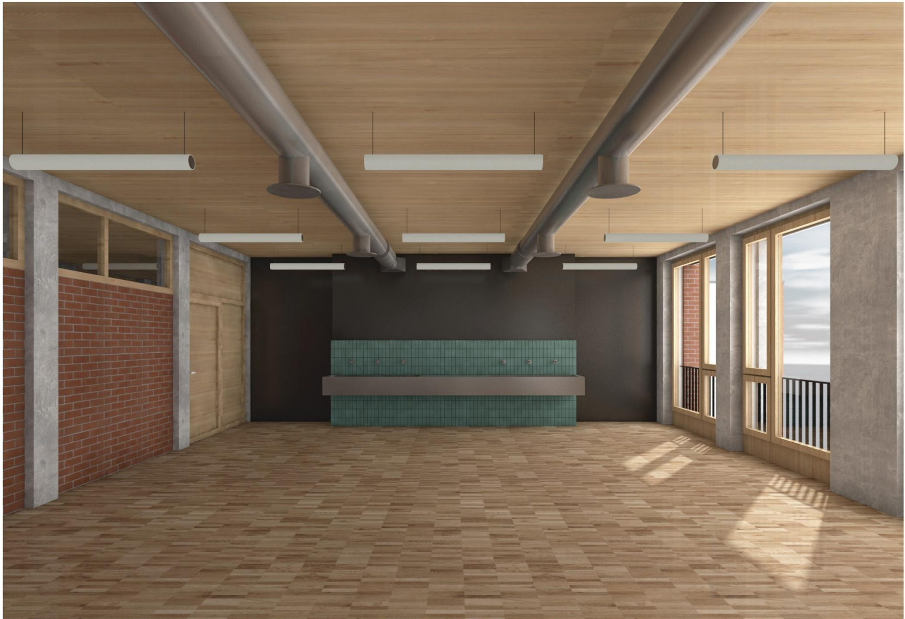
Unterrichtszimmer Bildnerisches Gestalten