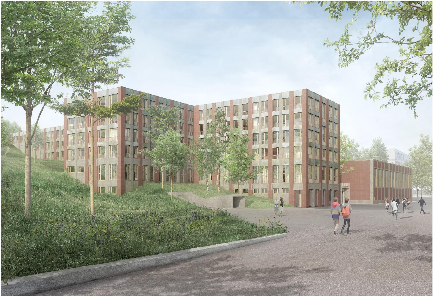
Blick von der Gwattstrasse