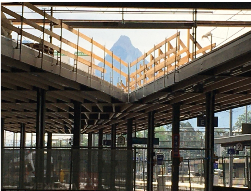
Abbildung 3: Bauarbeiten Bahnhof Arth-Goldau