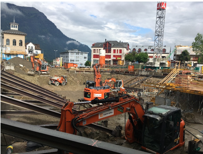
Abbildung 2: Bauarbeiten Bahnhofplatz Arth-Goldau

Reisende profitieren vom neu ausgebauten Bahnhof und Bushof Arth-Goldau mit modernen, behindertengerechten Einrichtungen.