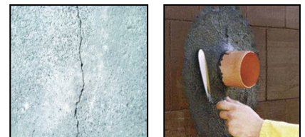
Abdichtung von Rissen und Leitungsdurchführungen