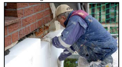
Isolierung der Gebäudehülle