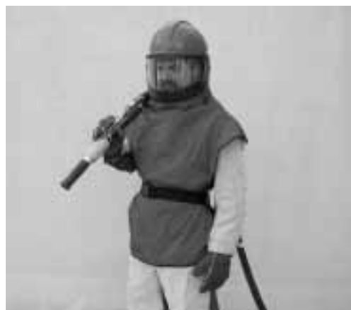
Bild 5: Persönliche Schutzausrüstung, bestehend aus Strahlerschutzgerät, Prallschutz für Schultern und Körper, Schutzhandschuhen, geschlossener Arbeitskleidung.