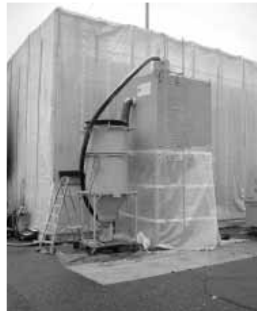
Bild 2: Absaug- und Entstaubungsanlage, Einhausung mit leichtem Unterdruck.