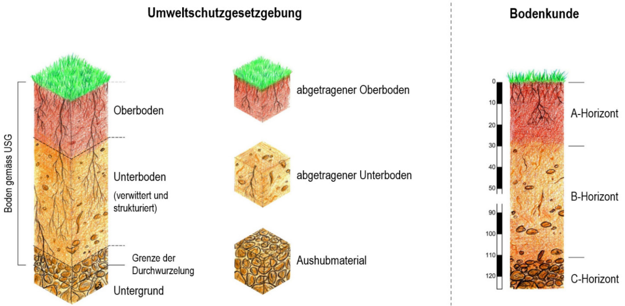
Abbildung 1 Die verschiedenen Definitionen des Bodens und der Geltungsbereich des USG

Die folgende Abbildung 1 illustriert unterschiedliche Definitionen von Boden. Die bodenkundlich definierten Horizonte sind massgebend für die Herleitung der Eigenschaften als Grundlage für die Festlegung der erforderlichen Bodenschutzmassnahmen. Wurzeln von Pflanzen (z.B. von Bäumen oder von invasiven gebietsfremden Pflanzenarten) können bis in den unverwitterten Untergrund reichen, weshalb die Bodendefinition des USG auch dafür gelten kann.